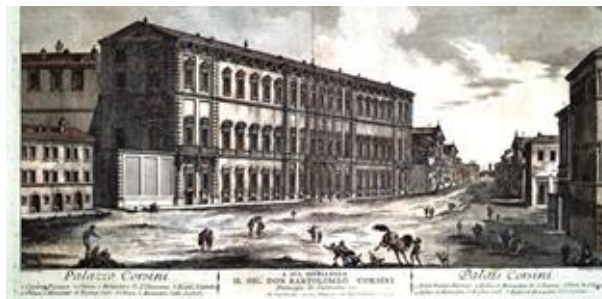
PALAZZO CORSINI in una incisione di J. Barbault (1763)